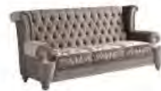
ADAM immagini p 13