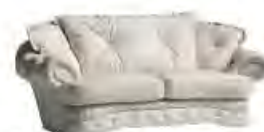
RENAISSANCE immagini p 115