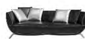
MEETING immagini p 163