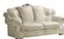
LANGLEY immagini p 103