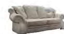
KIARA immagini p 49