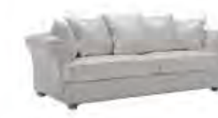
ISABEL immagini p 63