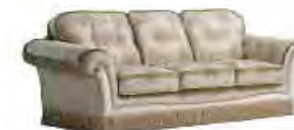
MOZART immagini p 45