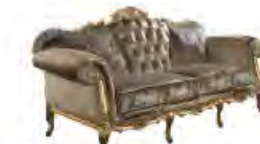
EDWARD immagini p 91