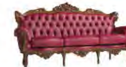
DORIS immagini p 99