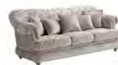
MASHA immagini p 123