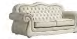
VIVALDI immagini p 119