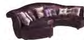
ALLEGRETTO immagini p 159