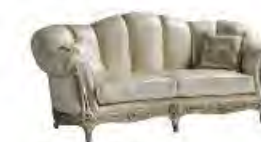
CARLOS immagini p 95