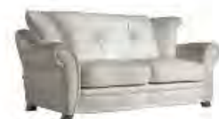
FLAME immagini p 59