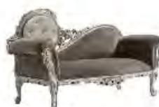
REGGY immagini p 83