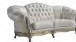
BOTTICELLI immagini p 87