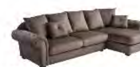
THOMAS immagini p 127