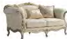
ELISABETH immagini p 75