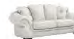
NIDO immagini p 151