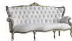
BACH immagini p 79