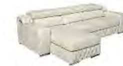
ASTER immagini p 147