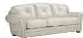
TENNIS immagini p 131