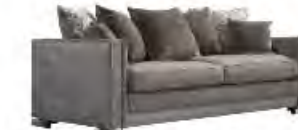
PADDINGTON immagini p 135