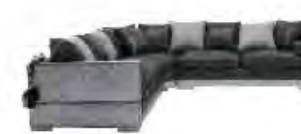
HILTON immagini p 139