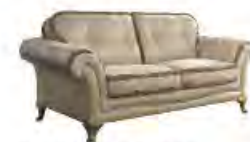
BEETHOVEN immagini p 39