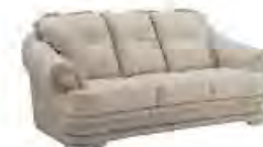
HALIFAX immagini p 107